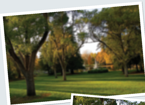
visão com catarata

Este folder foi desenvolvido para que você possa conhecer um pouco mais sobre o problema, mas lembre-se: nada substitui a orientação de seu oftalmologista.